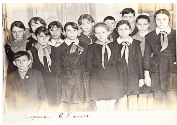
Следопыты отряда имени В.М. Комарова Шатковской средней школы

Многие годы пионерская организация была для ребят и взрослых школой жизни. Но не всё было так гладко в истории пионерской организации... 90-ые годы стали временем серьёзной проверки сделанного и достигнутого, оценки значимости общественной активности детей и подростков, выбора нового пути. К 1991 году пионерская организация закончила свое существование вместе с развалом СССР. И с 1 октября 1990 года ее приемником стал Союз пионерских организаций – Федерация детских организаций (СПО-ФДО). 15 января 1991 года был создан Союз пионерских организаций Нижегородской области, девиз которого «За Родину, Добро и Справедливость!»