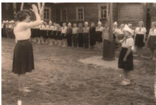
Пионерская дружина Смирновской средней школы, 1950 – 1960-е годы