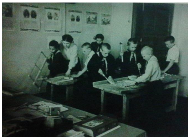
Пионерская дружина Смирновской средней школы, 1950 – 1960-е годы