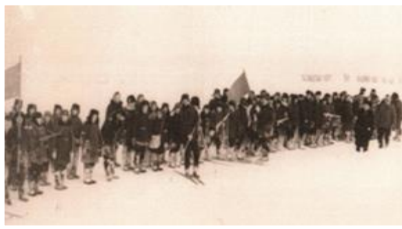
Военно-спортивная игра «Зарница», пионерская дружина Смирновской средней школы, 1967 год

Говоря о пионерской жизни тех лет, нельзя не вспомнить о военно-спортивной игре «Зарница», в которой с удовольствием участвовали несколько поколений пионеров. Стартовала «Зарница» в январе 1967 г. Эту пионерскую игру называют самой массовой игрой XX века. В каждой школе она проходила каждый год. В ходе игры пионеры делились на команды и соревновались в различных военно-прикладных видах спорта с игровыми элементами. Ребята любили эту игру за то, что можно было с головой окунуться в боевой дух состязаний.